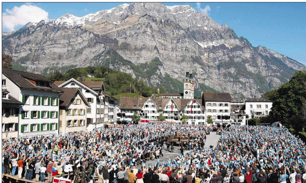
Il cumin da Glaruna.

Dapli infurmaziuns: chatta.ch/?hiid=1834 www.chatta.ch